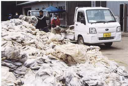
JA職員 ビニールを下ろす生産者と

この4日 間の回収量 は、ビニー ル約138 ト、ポリオ レフィン約 63トとなり、 資材焼却時 の熱利用や 園芸用の鉢 などにリサ イクルされ ます。