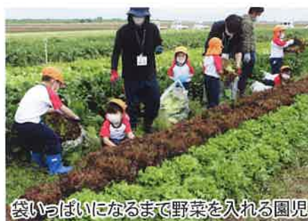
袋いっぱいになるまで野菜を入れる園児