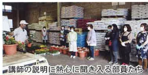
講師の説明に熱心に聞き入る部員たち

女性部は、岩井、馬田、七重の各支部でも花や鉢を用意し、各家庭で寄せ植えを楽しんでもらいました。