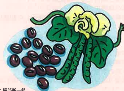
イラスト：服部新一郎

日本人に最もなじみのある豆の一つ、小豆。 低脂肪で高タンパク質、ヘルシーな上に 不足しがちな栄養素を豊富に含む、 魅力的な食材です。 毎日の食事にぜひ取り入れたいですね。