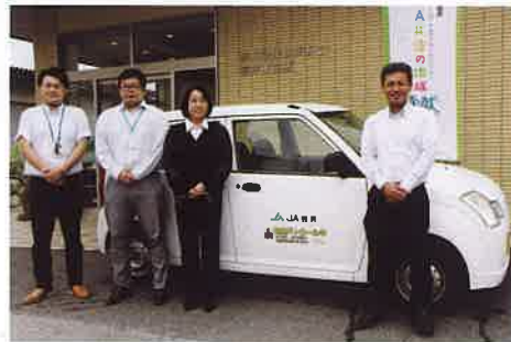
染谷支店長(右)と信用渉外職員

J A は9月、本店と金融店舗4支店で使用している営業車20台にドライブレコーダーを設置しました。既に設置している