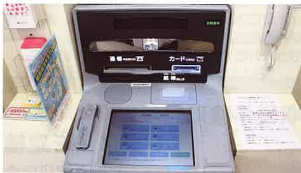
抗菌フィルム・通帳繰り越し機能が備わったATM

また、現在、 岩井東支店・岩井南支店 のATMに、普通貯金や総合口座の通帳繰り越し機能が備わりました。記帳する余白が無い通帳で、ATMの稼働している時間内であれば、いつでも繰り越しが可能です。ご利用の際には、新しい通帳と繰り越し前の通帳の2冊戻ってくるので忘れずにお受け取りください。