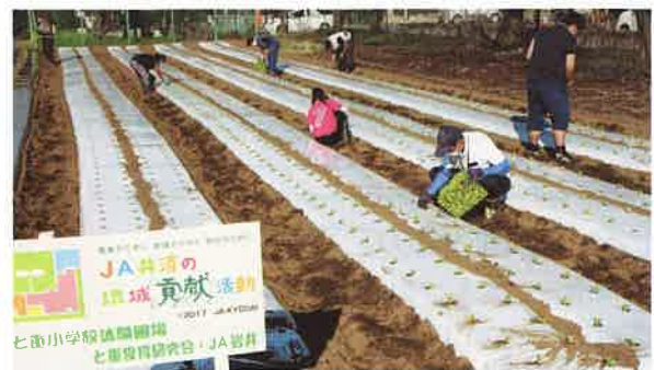
収穫体験に向け、レタス苗を定植