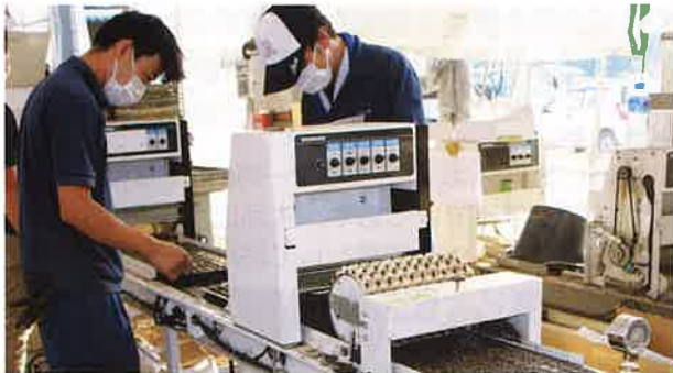
全自動機による播種作業

JA岩井管内では、来年4月以降出荷の初夏ねぎの播種時期を迎え、JA営農センターで9月24日から共同播種作業が始まりました。この時期は、秋野菜の出荷や春野菜の準備が重なるため、播種作業の時間短縮・省力化が必要となり、利用する農家の方が増えています。また、播種時期や育苗箱に蒔く種