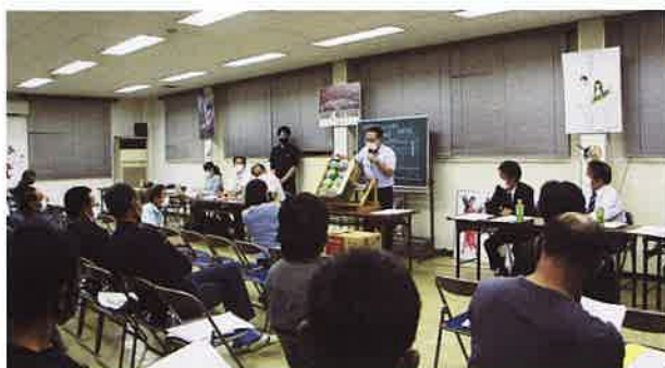
出荷の注意点を説明するJA担当者

JAのレタスは京浜市場をはじめ各主要都市に出荷し、年内62万箱(1箱10 kg )の出荷を計画しています。