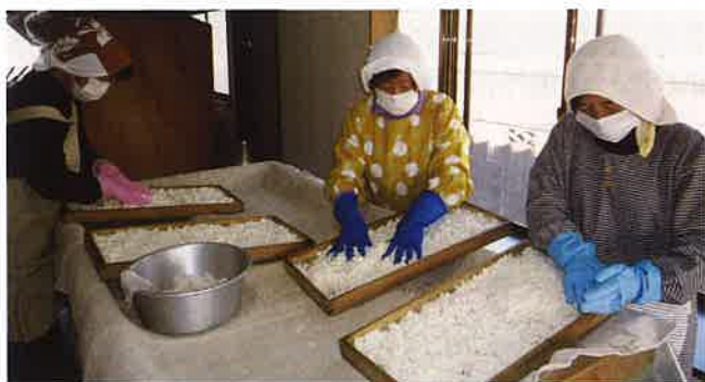
蒸した精米に種麴を加えて揉み込む様子

35人の参加者を3～5人のグループに分けて、米麴を作るところから始めます。蒸した精