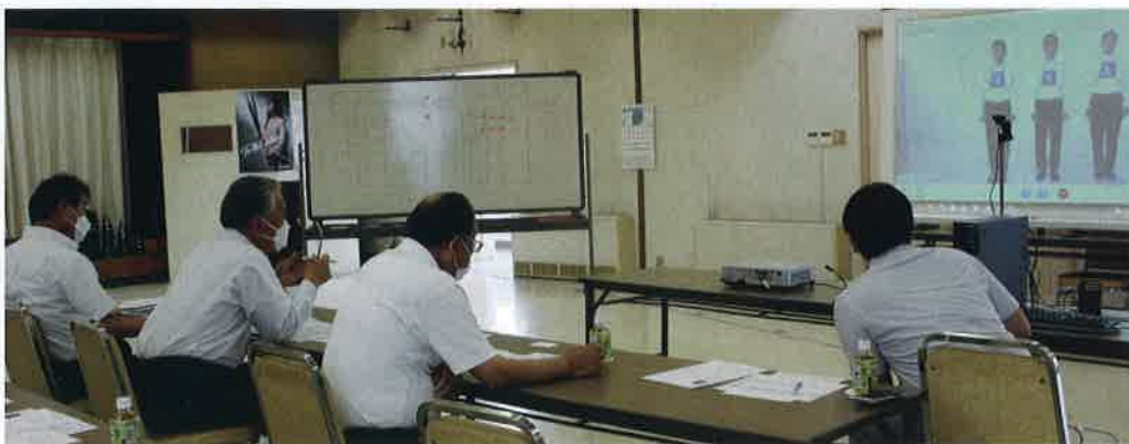
インドネシア人技能実習生と面談するJA役職員

JAの風見組会長は、「現地ではどんな作物を栽培しているのか」「日本で習得したい農業技術は何か」などの質問をして、候補者選定にあたりました。