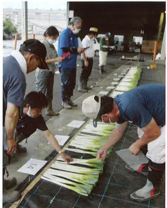
立毛競作会現物審査の様子

JAと園芸部生産委員会は8月5日、園芸部員が栽培する青果物を「圃場」と出荷する状態の「現物」で審査・採点する「夏ねぎ立毛競作会」を行いました。昭和54年に始まったこの取組みは、産地を牽引する栽培技術を持った優秀な生産者を表彰し、産地全体の品質向上と生産意欲の高揚を図ってきました。開始当初はトマトやナスを対象にしていたましたが、現在では夏ねぎ出荷最盛期の5月から8月に14圃場ずつ審査を行い、各月の最優秀賞4人を決定、更にもその中から最優秀特別賞の茨城県農林水産部長賞を受賞する生産者1人を決定しています。審査員は園芸部生産委員の他、普及センター、市農業政策課、市場担当者、JA営農部職員などが務め、審査・採点後は、順位と生産者それぞれの栽培方法を優良な事例として集約して、冊子で全園芸部員360戸へ配布して活用されます。