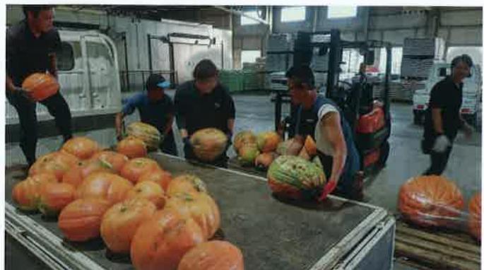
どでカボチャを計量する研究会役員とJA職員

※トリックオアトリートとは…10/31のハロウィンに子どもたちがキャンディやお菓子を貰うために声を揃えて「Trick or Treat!」 トリック と言います。日本語にすると「いたずらされたくないならお菓子をちょうだい!」です。