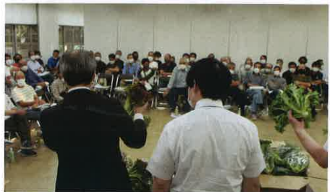
選別時の注意点を説明する市場担当者(旧予冷センターにて)

目ぞろえ会では、市場担当者やJA職員が資料や出荷されているレタス、サニーレタス、グリーンカールを用いて選別や出荷の注意点を説明。9月に出荷が始まったレタスは、12月までで70万袋(1袋10kg)、サニーレタス・グリーンカールは計13万袋(1袋4.5kg)の出荷を見込んでいます。