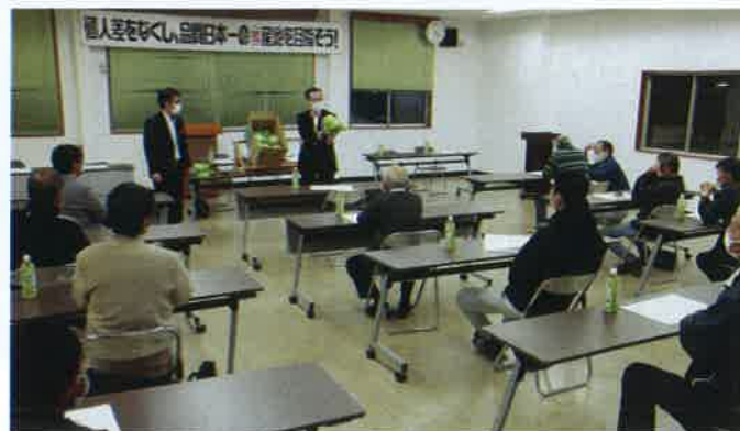
レタスの大きさ・形状・品質について説明する市場担当者

また、会議に出席した産地・JA全農・市場が協力して、加工・業務用野菜の取引先や消費者に向けた理解醸成を進めていくための方策が協議されました。