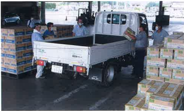
園芸部役員によるペットボトル飲料の受け渡し

岩井農協園芸部は7月15日、旧予冷センターにて園芸部員各戸にペットボトル飲料を配布しました。この取組みは「熱中症予防による園芸部員の健康維持と青果物の安定出荷」を目的に、コロナ禍において各種行事が制限される中「今、私たちにできること」を実行し、食を支える責任産地として青果物の安定供給を支援するためのものです。