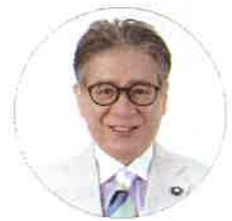
気象予報士 森田正光さん (ウェザーマップ)

1950年愛知県名古屋生まれ。財団法人日本気象協会を経て1992年、全国初のフリーお天気キャスターとなり、気象予報会社・株式会社ウェザーマップを設立。親しみやすいキャラクターと個性的な気象解説で人気を集め、テレビラジオなど多方面で活躍中。