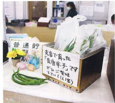
青トウガラシご賞味ください