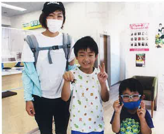
クワガタを手を持つ子どもたち

現在ではカブトムシ・クワガタの配布は終了となりましたが、第2弾として岩井南支店の花壇で育てた青トウガラシが実を付け始め、収穫したものを少しずつ袋に入れて来店される皆さまにお譲りしています。