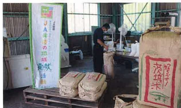
寄付するお米の準備をするJA職員

JAでは、JA共済の地域貢献活動の一環としてこのプロジェクトに協力し、県内の子どもたちに食と農への興味・関心を高めて欲しいという願いがあります。今後も地域との絆を強化し、組合員・地域住民の皆さまが住み慣れた地域で、健康で安心して暮らせる豊かな環境づくりに貢献していきます。