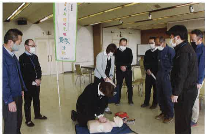
胸骨圧迫について体験する職員

1分1秒が重要となる救命処置では、日頃から設置場所や操作方法の確認をしておくことが重要です。