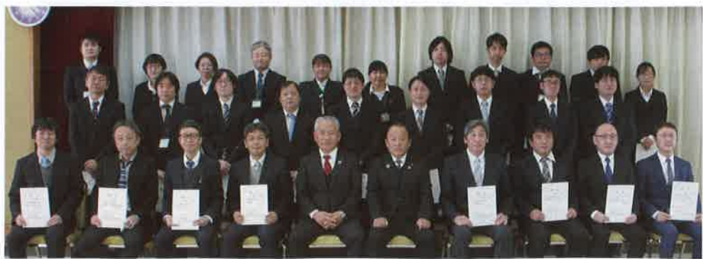
風見組合長・飯塚専務(中央)と辞令交付を受けた職員