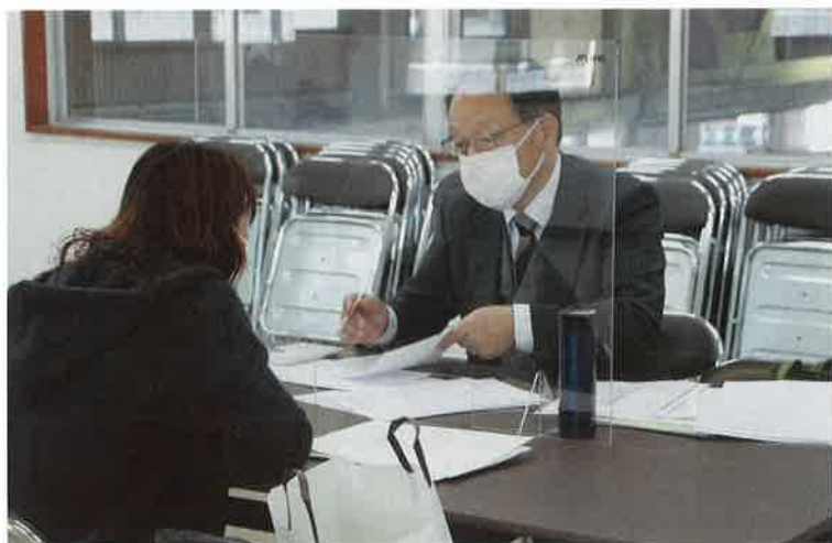
税理士会担当者との個別相談の様子

岩井農協農業青色申告会は3月2日・3日、旧予冷センターで確定申告の個別相談会を開き、事前予約をした会員17人が来場しました。