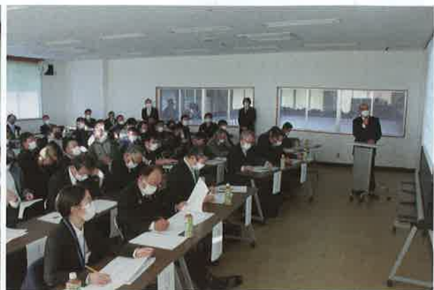
試験研究成果を発表する青年部員