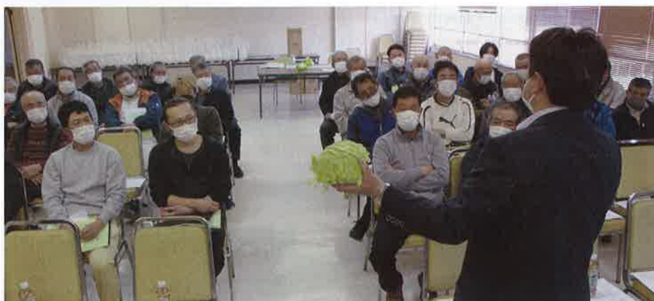
注意点を説明する市場担当者

JAのレタスは「こだわり惚レタス」の愛称で、ピンクのハートをあしらった専用ラップで包装し、全国の主要都市に出荷されます。天候の安定により順調な生育で、4月中旬までピークが続きます。1日約2万ケース前後（1ケース10 kg ）を出荷し、5月までに63万ケース、サニー惚レタス、グリーン惚レタスは計12万ケースの出荷を見込んでいます。