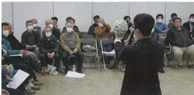
選別時の注意点を説明する市場担当者

当JAのレタスは「こだわり惚レタス」の愛称で、ピンクのハートが目をはく専用ラップで出荷されています。春は5月までに60万ケース(1ケース10 kg )、サニー惚レタス、グリーン惚レタスは計10.5万ケース(1ケース4.5 kg )の出荷を見込んでいます。