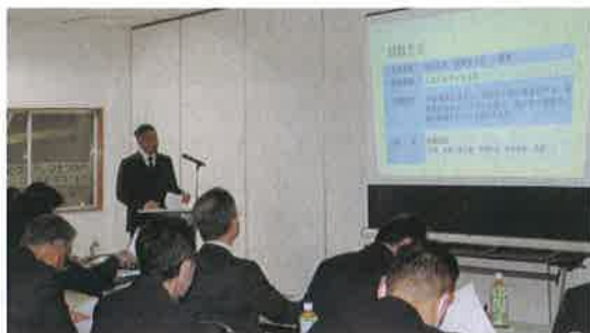
試験研究結果を発表する青年部員