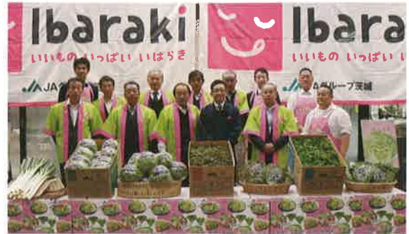
市場内に設置した特設PRブース

集まった市場内の関係者ら約200人にレタスを一玉ずつ無料配布した他、レンジで加熱してオイスターソースとごま油をかけるだけの簡単レシピ「瞬間消滅レタス」を試食してもらった、「サラダ以外にもこんな食べ方があるんだ」「食べ方の提案までできると販売しやすい」などの声が聞かれ、特設PRブース前は行列ができるほど多くの関係者で賑わいました。