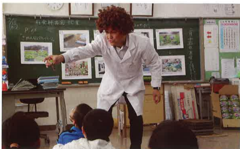
レタス苗を見せて説明する野菜博士

種まきから始まるレタスづくりが、最終的には食卓に並び、おいしく楽しく食べるためのレシピ紹介までを「レタスのたび(旅)」と称してパネルを使って説明。また、コーティング種子や専用の収穫包丁、出荷されたレタスなどを使って一連の農作業を詳しく説明しました。