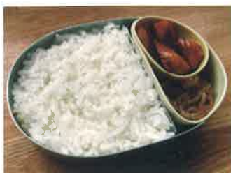
子どものお弁当はご飯とおかずが7対3

お弁当作りだけでなく普段の食卓でも「ご飯をしつかり食べ、その比率を増やすこと」を意識してみてください。いかがでしょうか。