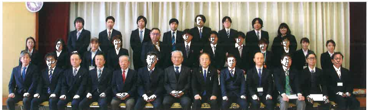
常勤役員・異動対象となった職員