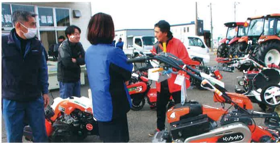
農機・車両展示の様子

JAは2月27日、営農センターで農機・車両ミニ展示会を開きました。管内主力品目のレタスやねぎの出荷が本格化する時期に合わせて毎年開いているもので、トラクターや管理機、軽トラックなど25台を展示しました。この日訪れた生産者約30人からは、日頃のメンテナンスや部品交換、買い替えなどの相談があり、農機車両部職員が対応したほか、本支店の融資担当職員が新認定農業者育成資金や農業近代化資金など、農業融資に関する情報提供や融資相談に対応しました。融資課長は「これからも生産者に向けた有益な情報提供を継続し、JA側から積極的な融資推進を展開したい」と話しました。