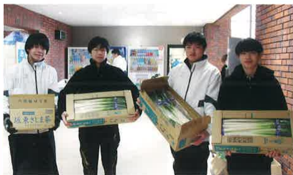
特産ねぎを受け取る高校生