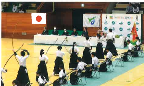
28m先の的を狙う高校生の部の射手

笑顔でねぎを受け取った いで 射手らは、競技に入ると真剣な表情に変わり、遠く離れた的に矢が刺さるたびに応援席から大きな歓声が上がりました。