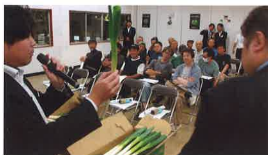
箱詰め・品質を確認する市場担当者 (経済センター2階)