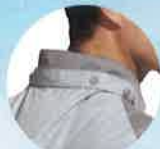
フード取り外し仕様