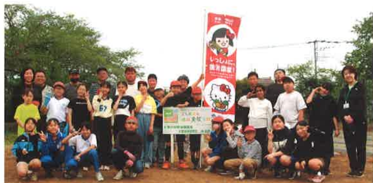
定植作業を終えた子どもたちと記念撮影

7月には収穫・試食会を計画している他、学校給食への食材提供を目指す児童たちは、食育研究会と一緒に生育管理を行っています。