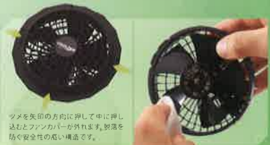
ファンを外して本体内部の拭き掃除が可能