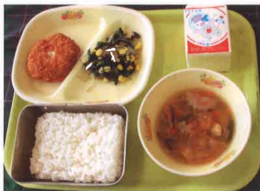
レタスの中華スープ(右下)