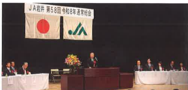
あいさつする風見組合長(中央)と来賓の皆さま(右)