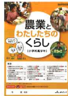
お届けした教育本